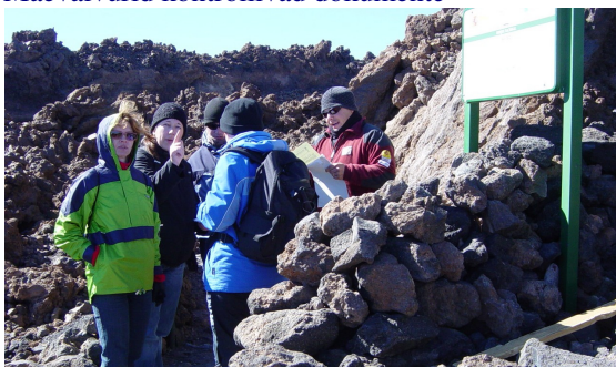
Mäevalvurid kontrollivad dokumente