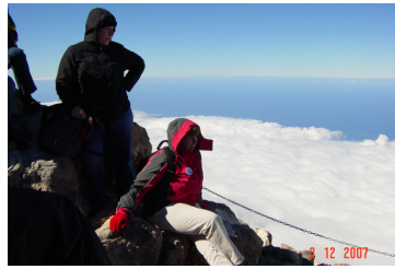
Hispaania kõrgeim tipp